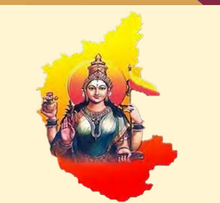
63ನೇ ಕನ್ನಡ ರಾಜ್ಯೋತ್ಸವ-2018