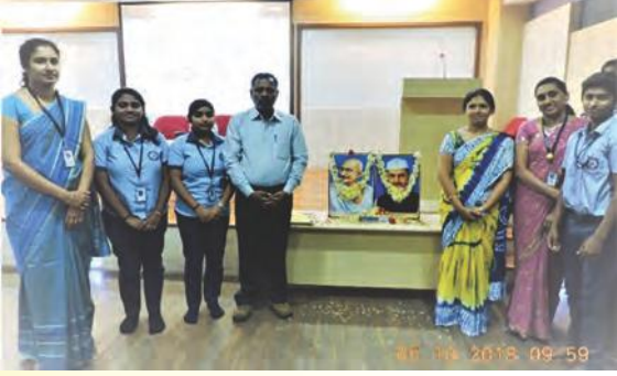
Gandhi Jayanthi and Birth Anniversary of Lal Bahadur Shastri Celebrations at Mysuru Campus.

On 2 Oct. 2018, S.C.P.U.C., Seshadripuram celebrated Gandhi Jayanti by offering a floral tribute to the Mahatma. This was followed by the rendition of Gandhi Bhajans by the students. Parent – Teacher Meet was conducted on the same day and 800 parents attended the Meet.