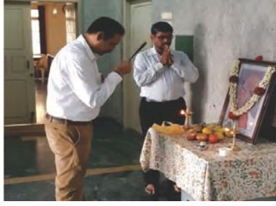
Gandhi Jayanthi at Seshadripuram Commerce College and Seshadripuram Independent P.U. College, Magadi Road.