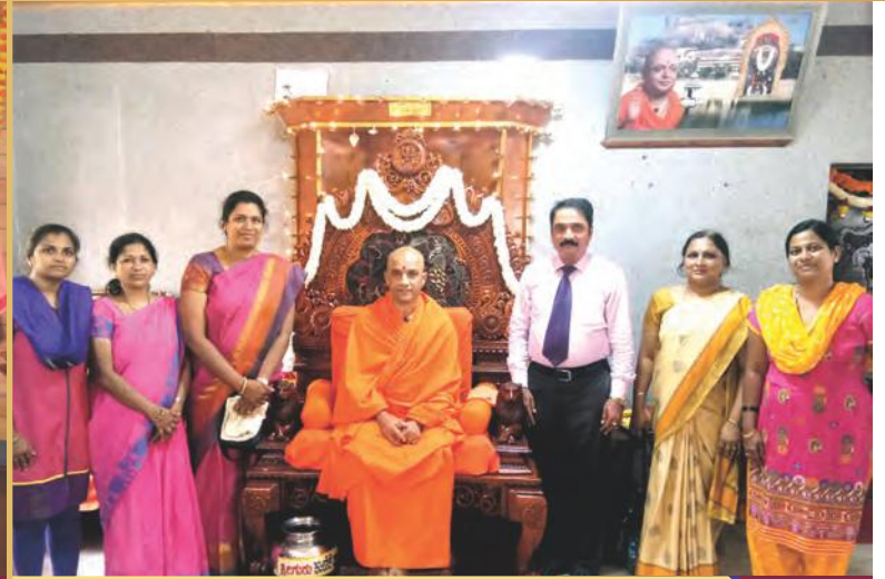
NSS Camp at Sri Adhichunchanagiri Matha