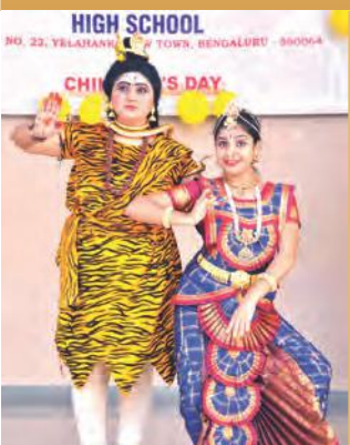
Children's Day 2018