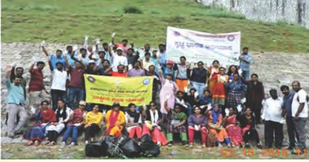
Jayanthi for staff members and students of Seshadripuram Degree and P.U. College, at Kabini reservoir in H.D. Kote.

On 2 Oct. 2018, Seshadripuram Degree College, Mysuru's Gandhi Study Centre in association with National Service Scheme, celebrated Gandhi Jayanthi and the Birth Anniversary of Lal Bahadur Shastri. A Shramadhan was organised on account of Gandhi