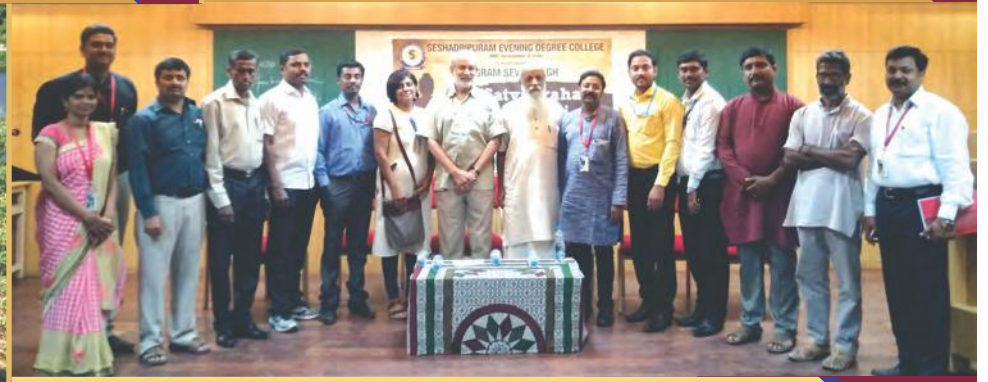
ಬಾ-ಬಾಪು 150ನೇ ಜನ್ಮ ದಿನಾಚರಣೆ