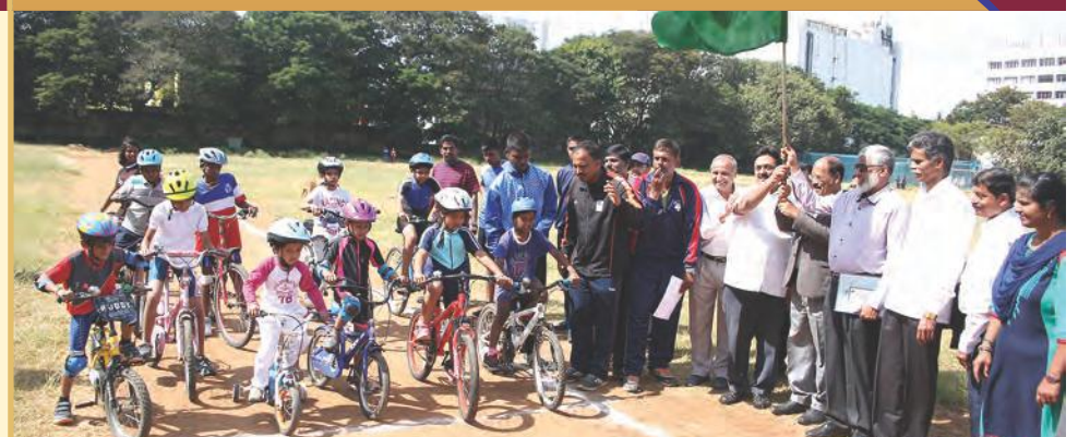
Bangalore District Track Cycling Championship 2018