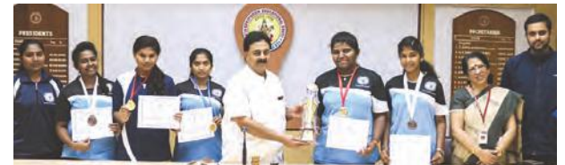
Runners-Up of Bangalore University Inter-Collegiate Weightlifting Competition for Women 2018-19.