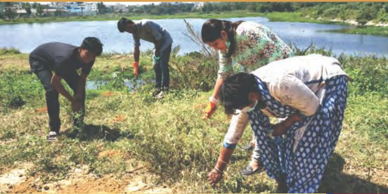
Arekere Lake Cleanliness Drive