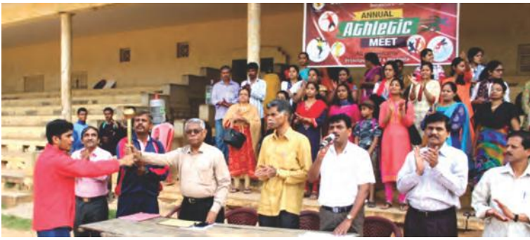
On 12 Oct. 2018, S.P.U.C., Seshadripuram held its Annual Athletic Meet at Central College Cricket Grounds, Gandhinagar.