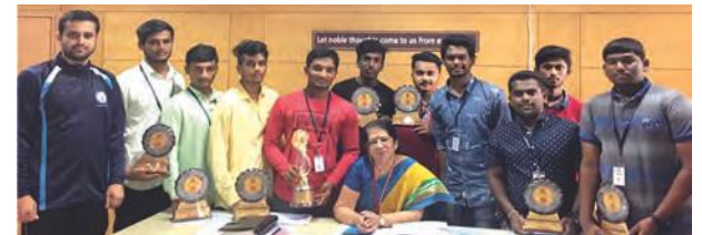
Runners-Up of Bengaluru Central University Inter-Collegiate Kabaddi Competition for Men 2018-19.