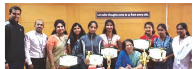
Runners-Up of Bengaluru Central University Inter-Collegiate Table Tennis competition for Women 2018-19. Runners-Up of S.E.T. Inter-Collegiate Table Tennis Competition for Women 2018-19.