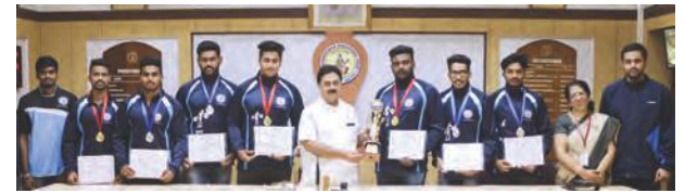
Winners of Bangalore University Inter-Collegiate Weightlifting Competition for Men 2018-19.